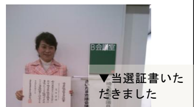
▼当選証書いただきました