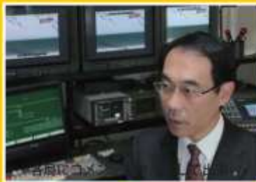
各局のニュース出演