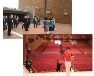
▲前川建築の良さをそのままに、内部の設備や機能をリニューアル