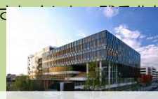
(東部) ふれあいキューブ

(熊谷)の拠点整備を進めようと県は新年度予算に調査費をつけましたが、政治抗争を背景に、自民会派から待ちがかりました。老朽化している県立2図書館は1館に統合して、この北部拠点と合築で建てる構想ですが、結果的にいつ整備できるか目