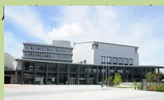
(西部) ウェスタ川越

ソニックシティが産業振興の拠点として整備された際、県内の東西南北にそれぞれ拠点をおくべきとの議論がなされ、年月をかけて東部(春日部)、西部