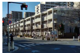
▲本郷町南東端角信号に右折矢