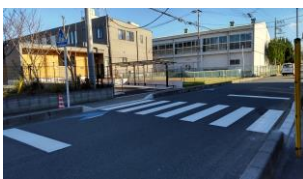
▲今羽町の新しい保育園前に横断歩道